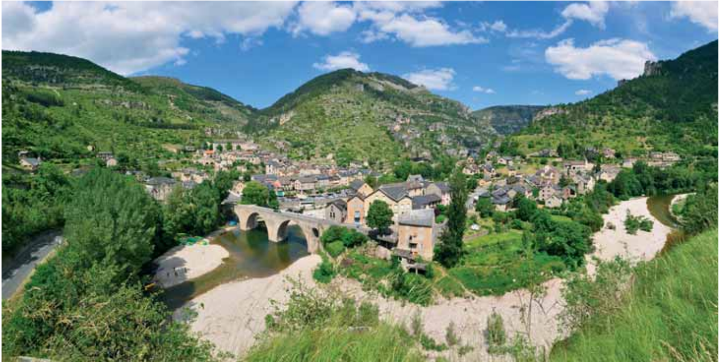
France Passion offre aux camping-caristes une bonne occasion de découvrir la France de manière très personnelle.