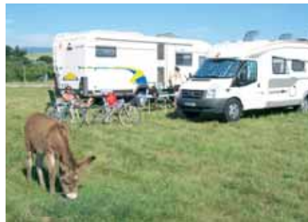
Parfois sur les terres d'un domaine prestigieux, parfois presque dans les champs: les emplacements proposés par France Passion sont très variés.

Le nombre de vigneron et d'agriculteurs qui permettent aux camping-caristes de passer une nuit sur leur terrain augmente chaque année. La 19 e édition du «Carnet des invitations» de France Passion comprend déjà 1600 adresses actuelles dans toutes les régions de France, dont 750 vigneron et 700 exploitations agricoles. Les emplacements sont donc nombreux en particulier dans la campagne française. Les métiers représentés par France Passion sont très divers. Les emplace-